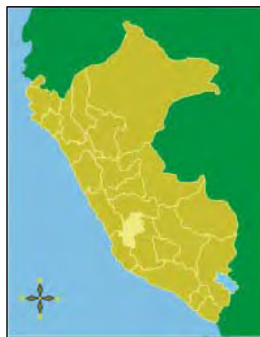
Imagen 1: Huancavelica en el Perú

Huancavelica es un departamento eminentemente rural considerando tanto el porcentaje de la población que vive en áreas rurales (74%) como el porcentaje de población rural mayor de 15