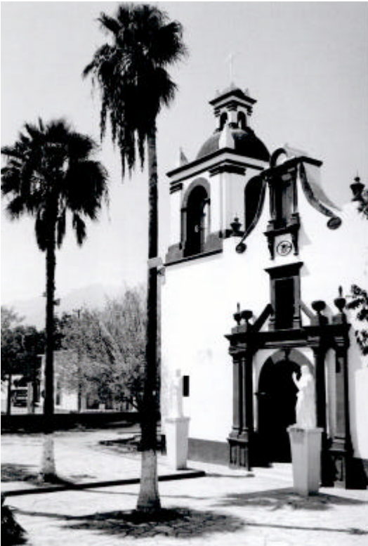
Templo de San Miguel Arcángel – Bustamante, N.L.

La arquitectura vernácula del noreste de México es una manifestación cultural muy peculiar que no ha recibido la suficiente atención, razón por la cual es escasa la literatura sobre el tema. Además, la arquitectura actual de la zona parece haber roto con su origen histórico. Hoy en día, la mayoría de los edificios catalogados como históricos y que son construcciones representativas de la arquitectura vernácula, se encuentran en una situación de olvido físico, no existe mantenimiento constante o en otros casos, es nulo.